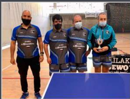
2º GAILAK "C"