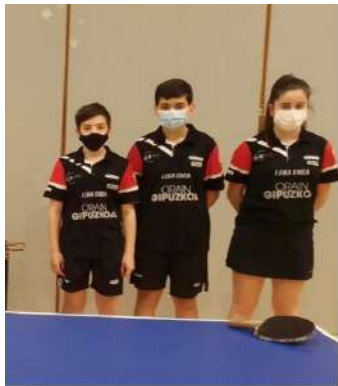
LEKA ENEA "B"