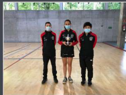
3º IRUN LEKA ENEA "B"